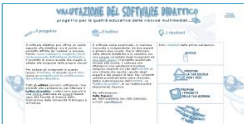
figura 1 La sezione "Valutazione del software didattico" del sito di INDIRE.

Si tratta di una sezione in cui non è privilegiato l'aspetto valutativo, ma la descrizione delle caratteristiche della sperimentazione,