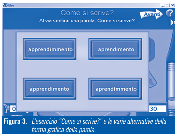
Figura 3. L'esercizio "Come si scrive?" e le varie alternative della forma grafica della parola.

Il secondo esercizio, "Come si scrive" (Figura 3), si basa invece sul riconoscimento fonologico della parola tramite un input uditivo e quindi la successiva individuazione del termine tra diverse forme grafiche della parola.