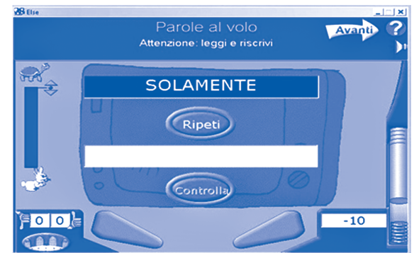
Figura 1. Come si presenta la schermata dell'esercizio "Parole al volo".

L'analisi a priori delle funzionalità del software ELSE ci ha orientato nella scelta della tipologia di esercizio "Parole al volo" (Figura 1), attraverso il quale proporre l'attività di lettura secondo l'approccio basato su morfemi. Questo esercizio consente di presentare una parola con un certo tempo di esposizione; il bambino deve leggerla ad alta voce e quindi scriverla correttamente. Il software valuta la capacità del bambino di riscrivere la parola in modo corretto, mentre la valutazione della lettura in termini di correttezza e velocità è lasciata a chi conduce l'esercizio.