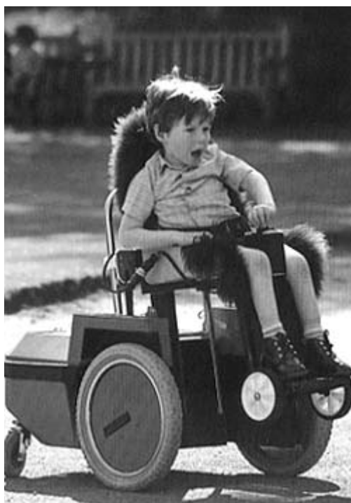
Carrozzina elettronica per bambini

Un'evoluzione del concetto di autonomia del bambino si nota nell'ampio successo delle carrozzine elettroniche negli ultimi anni soprattutto nel Nordamerica e nel Nord Europa.